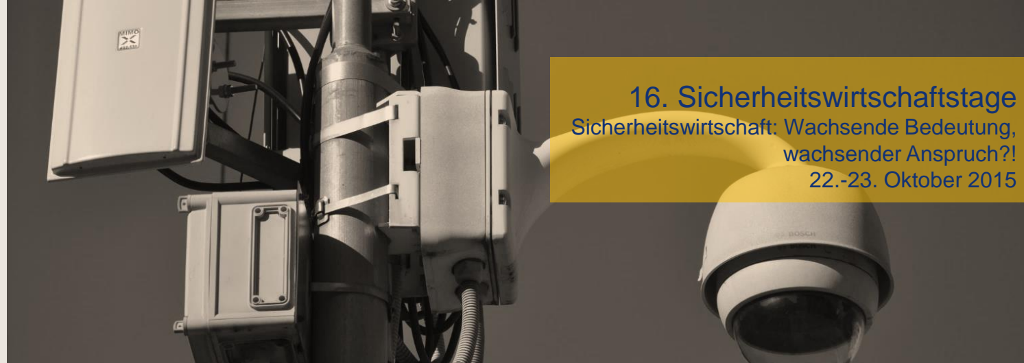
Dr. Thomas de Maizière, MdB [Bundesminister des Innern]

16. Sicherheitswirtschaftstage Sicherheitswirtschaft: Wachsende Bedeutung, wachsender Anspruch?! 22.-23. Oktober 2015